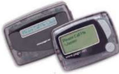
Medewerker 4 regel tekst pager 1 regel tekst pager