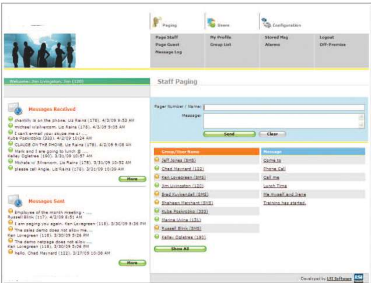
Screenshot van de pagina