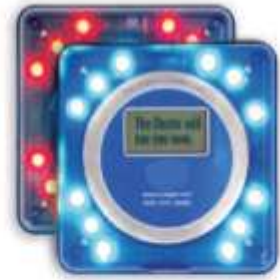
Gasten/Patiënten Pager 4 regel tekst pager anti diefstal modus