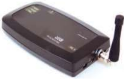
Zender 7400USB USB interface Afmetingen 7x13x2 cm